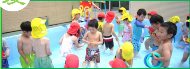
プール開き・プール遊び