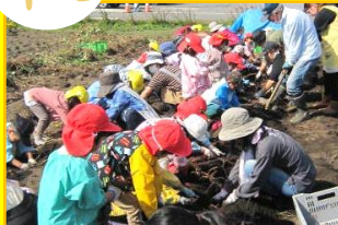
親子自然体験サツマ芋掘り