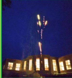
お泊まり保育(年長児)